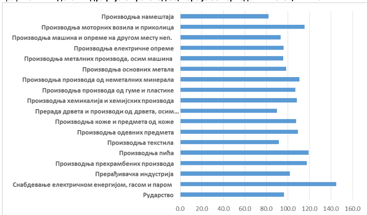
Графикон 2: Индекси индустијске производње, поређење периода I-XII 2018. / I-XII 2017.

Посматрано по наменским групама, забележен је највећи раст у производњи пића 19,4%, производњи прехранбених производа 17,6% и у производњи моторних возила и приколица 67,5 %.